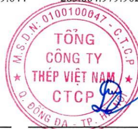
Nghiêm Xuân Đa