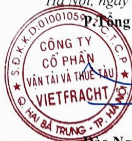
Đào Nguyên Đăng