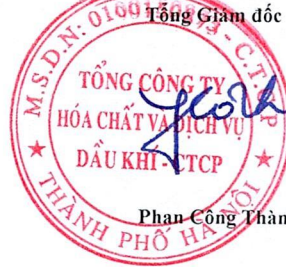
Phan Công Thành