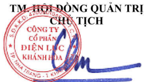
Nguyễn Cao Kỳ