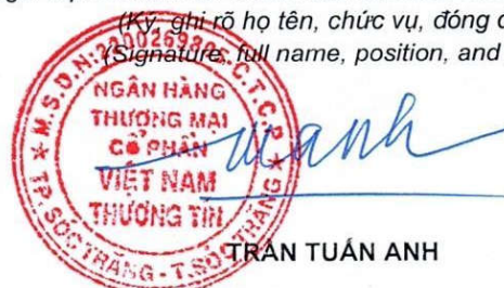
TRẦN TUẤN ANH

(Ký, ghi rõ họ tên, chức vụ, đóng dấu) (Signature, full name, position, and seal)