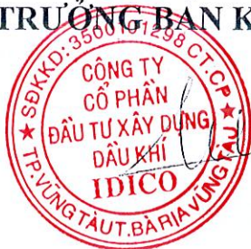
Đặng Chính Trung