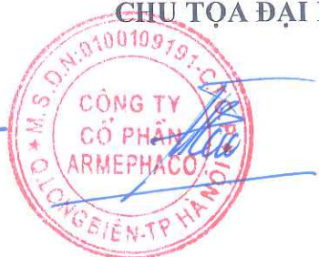
ĐOÀN MẠNH CƯỜNG