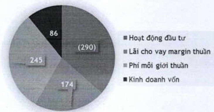
Lợi nhuận hoạt động ACBS năm 2022