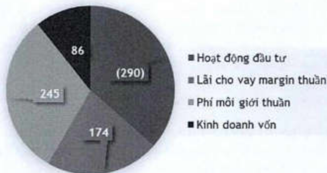
Lợi nhuận hoạt động ACBS năm 2022