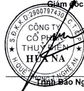
Tỉnh Báo Ngọc