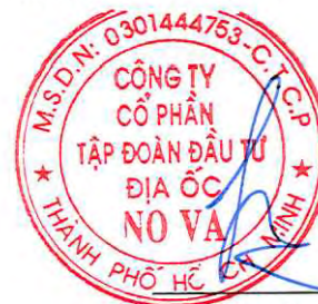
Phạm Nguyễn Người được Người đại diện pháp luật ủy quyền Ngày 30 tháng 1 năm 2023

Các thuyết minh từ trang 10 đến trang 54 là một phần cấu thành báo cáo tài chính riêng này.