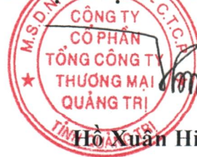
Hồ Xuân Hiếu