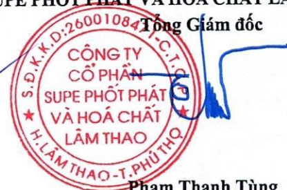
Phạm Thanh Tùng

(Các thuyết minh từ trang 10 đến trang 36 là bộ phận hợp thành của Báo cáo tài chính tổng hợp này)