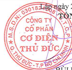
BÙI PHƯỚC QUĂNG