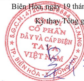
WU CHIA LING