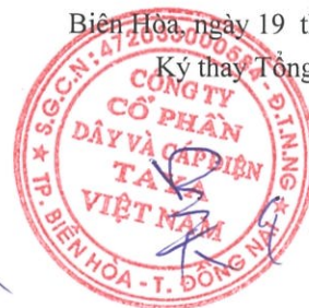
WU CHIA LING