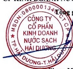
Phạm Minh Cường

(Các thuyết minh từ trang 6 đến trang 27 là bộ phận hợp thành của Báo cáo tài chính giữa niên độ này)