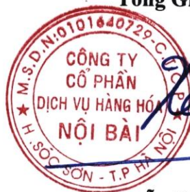
Nguyễn Xuân Phúc