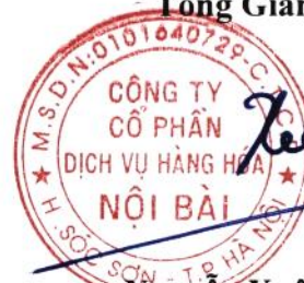
Nguyễn Xuân Phúc