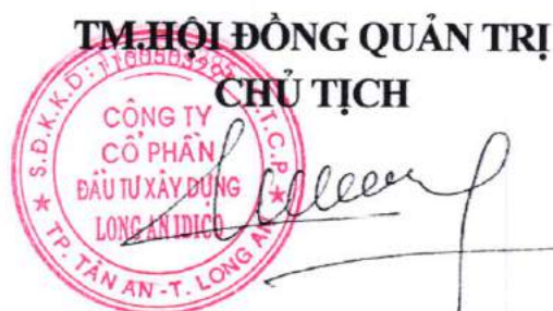
Đặng Chính Trung