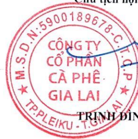
TRINH ĐÌNH TRƯỜNG