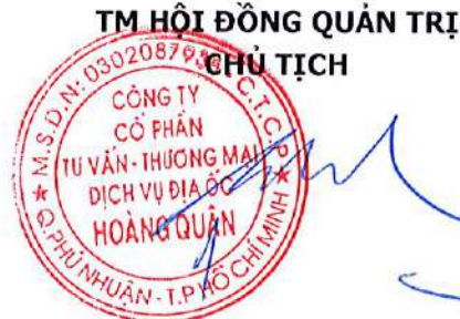
TRƯƠNG ANH TUẤN