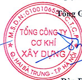
Đào Đức Thọ