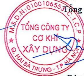
Đào Đức Thọ