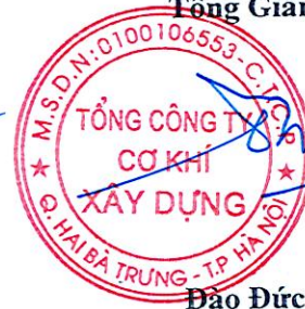
Đào Đức Thọ