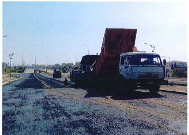
Thi công thâm BTN DA Đường Vành đai Phía Tây 2