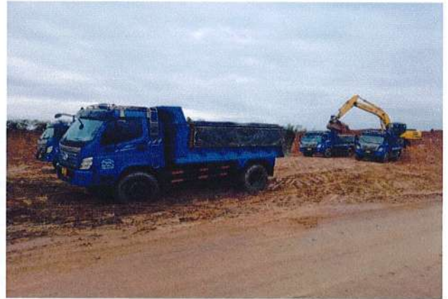
Khu ĐC Xã Hòa Phú, Hòa Vang, Đà Nẵng