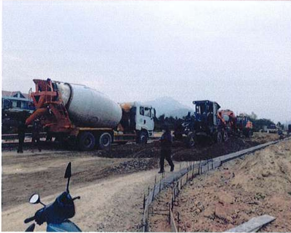
Dự án Đường Trường Sơn Đông (Gói 37G)