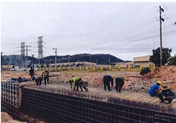
Công nhân thi công DA đường Vành đai 2 Đà Nẵng