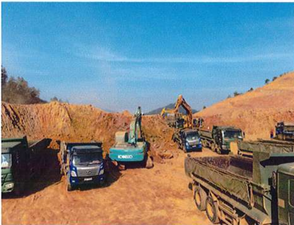
Thi công DA Đường Vành đai phía tây Đà Nẵng

- Một số dự án tiêu biểu của Công ty đã thi công: