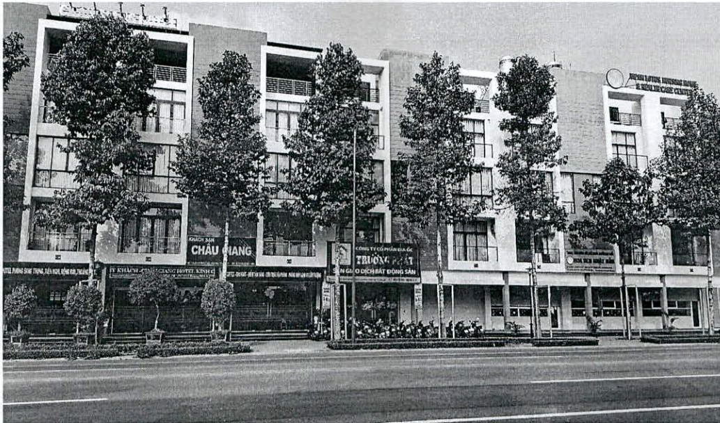
Hình ảnh nhà Dự án GREEN PEARL – TPM.BD (Giáp Đường Lê Lợi)