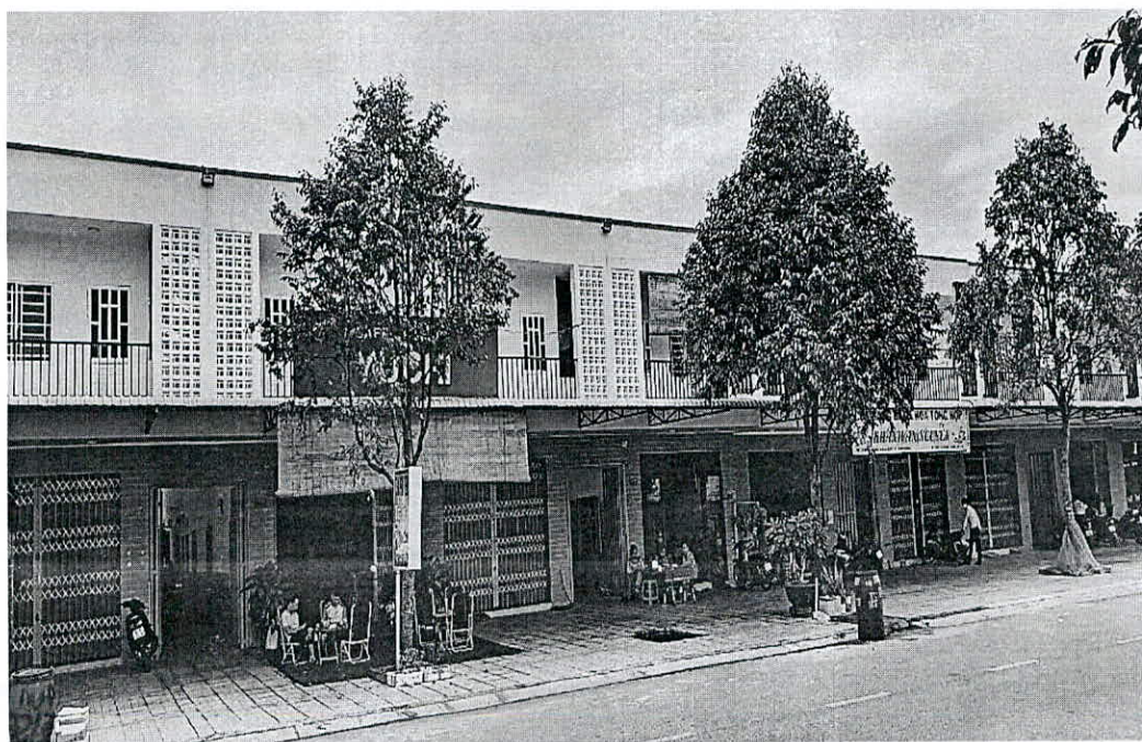
Hình ảnh nhà tại Lô A51/ Bàu Bàng (Bàn giao khách hàng)