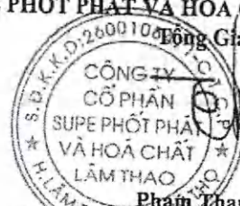
Phạm Thanh Tùng

(Các thuyết minh từ trang 10 đến trang 36 là bộ phận hợp thành của Báo cáo tài chính tổng hợp này)