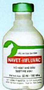
NAVET-VIFLUVAC (CÚM GIA CẨM)