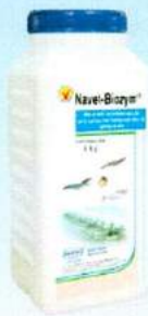
NAVET-BIOZYM TÔM, CÁ