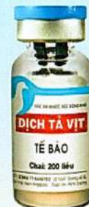
DỊCH TÁ VỊT TẾ BÀO