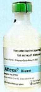
VẮC XIN LỞ MỠM LONG MÔNG...