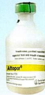
VẮC XIN LỞ MỠM LONG MÔNG...