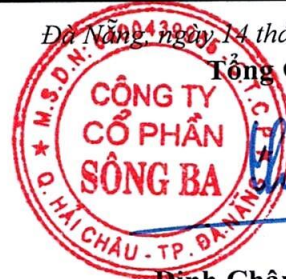
Đinh Châu Hiếu Thiện