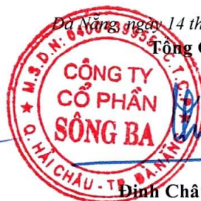
Đinh Châu Hiếu Thiện