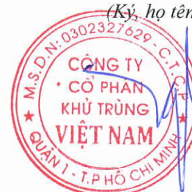
Trương Công Cứ