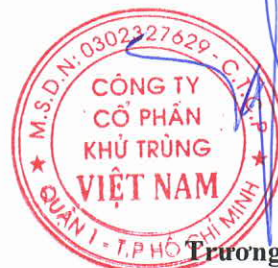
Trương Công Cứ