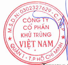
Trương Công Cứ