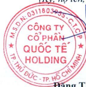
Đặng Thúy Vy