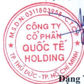
Đặng Thúy Vy