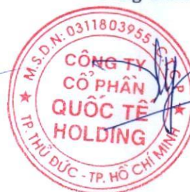
Đặng Thúy Vy