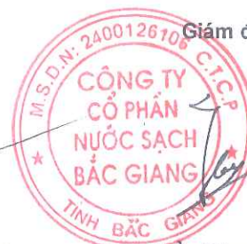
Trần Đăng Điều