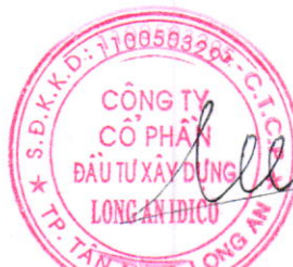
Đặng Chính Trung