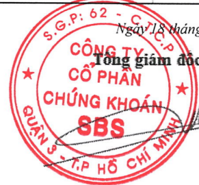
DƯƠNG MẠNH HÙNG