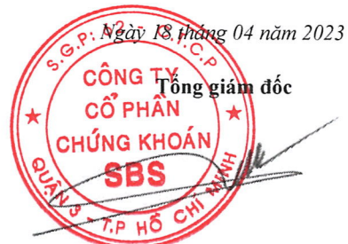
DƯƠNG MẠNH HÙNG