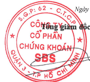
DƯƠNG MẠNH HÙNG