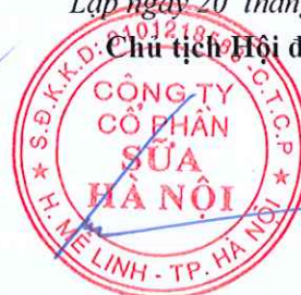
HÀ QUANG TUẤN