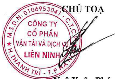
Ngô Xuân Phú