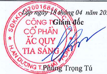
Phùng Trọng Tú