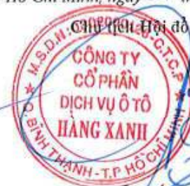
ĐỖ TIẾN DŨNG