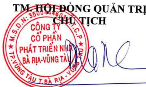
Đoàn Hữu Thuận