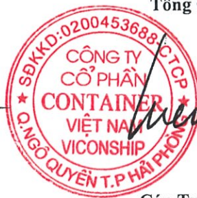
Cáp Trọng Cường