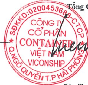
Cáp Trọng Cường