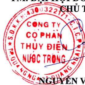
NGUYỄN VĂN CAO