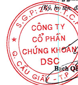
Bách Quốc Vinh