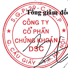
BẠCH QUỐC VINH