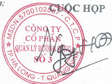
Nguyễn Quang Hải