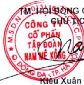
Kiều Xuân Nam

- Quy chế này gồm có 09 điều và được đọc công khai trước Đại hội đồng cổ đông để biểu quyết thông qua.