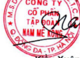
Kiều Xuân Nam