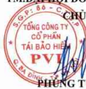
PHÙNG TUẤN KIÊN