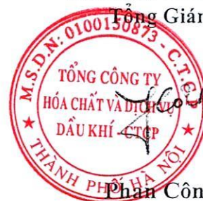
Phan Công Thành