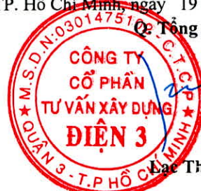
Lạc Thái Phước