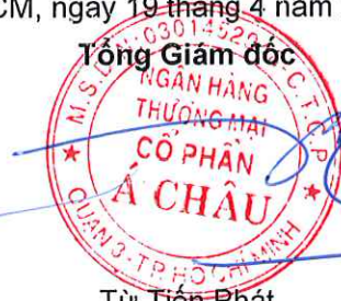
Từ Tiên Phát