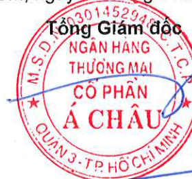
Từ Tiến Phát