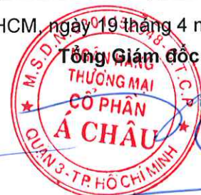
Từ Tiên Phát