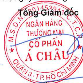
Từ Tiên Phát