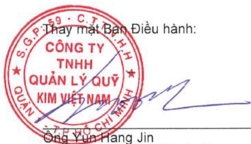
Ông Yun Hang Jin Chủ tịch Hội đồng Thành viên