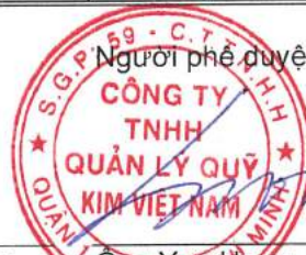
Ông Yun Hang Jin Chủ tịch Hội đồng thành viên