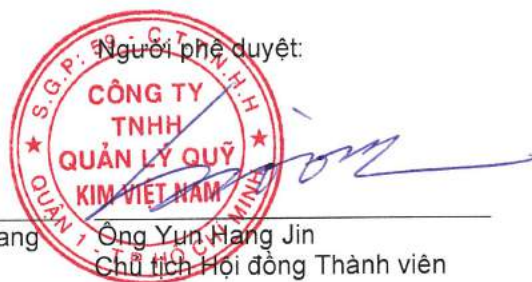
Ông Yun Hang Jin Chủ tịch Hội đồng Thành viên