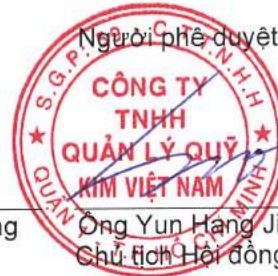
Ông Yun Hạng Jin Chủ tịch Hội đồng thành viên