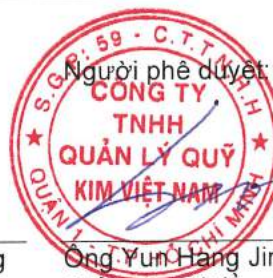
Ông Yun Heng Jin Chủ tịch Hội đồng Thành viên