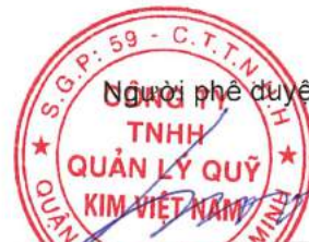
Ông Yun Hang Jin Chủ tịch Hội đồng Thành viên