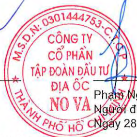
Phạm Nguyễn Người được Người đại diện pháp luật ủy quyền Ngày 28 tháng 4 năm 2023

Các thuyết minh từ trang 10 đến trang 55 là một phần cấu thành báo cáo tài chính riêng này.