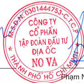
Phạm Nguyễn Người được Người đại diện pháp luật ủy quyền Ngày 28 tháng 4 năm 2023

Các thuyết minh từ trang 10 đến trang 55 là một phần cấu thành báo cáo tài chính riêng này.