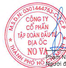
Phạm Nguyễn Người được Người đại diện pháp luật ủy quyền Ngày 28 tháng 4 năm 2023

Các thuyết minh từ trang 10 đến trang 55 là một phần cấu thành báo cáo tài chính riêng này.