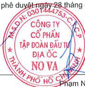
Phạm Nguyễn Người được Người đại diện pháp luật ủy quyền Ngày 28 tháng 4 năm 2023