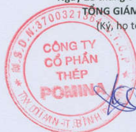
ĐỖ TIẾN SĨ